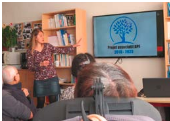
Réunion contributive à la délégation du Cantal (15) le 15 novembre dernier

Toutes ces contributions ont ensuite été synthétisées axe par axe par le