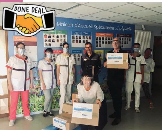
Livraison de visières par le directeur de l'usine Renault de Douai.